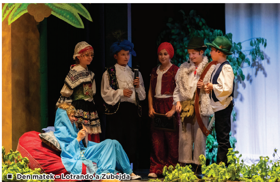
Den matek = Lotrando a Zubějda