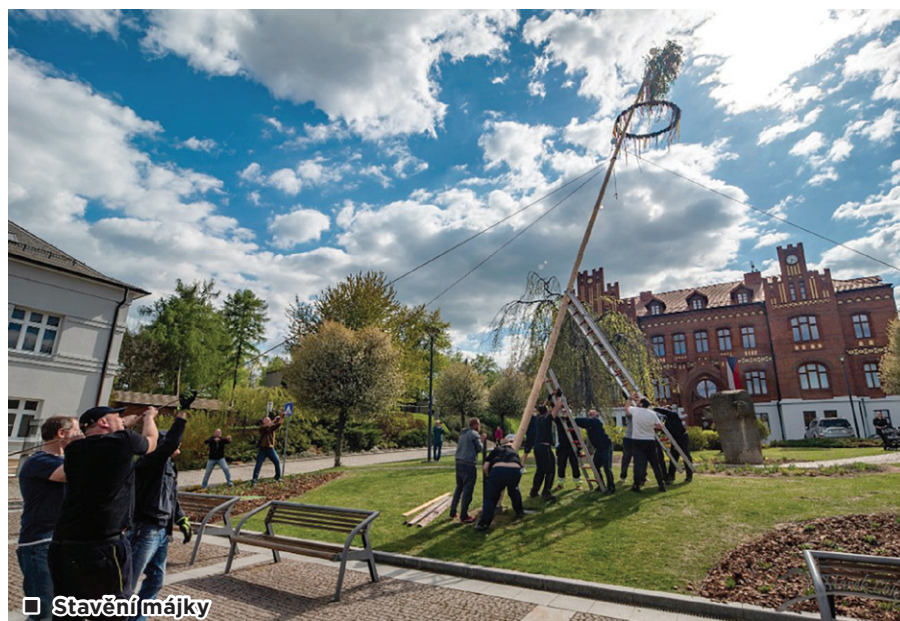
□ Stavění májky