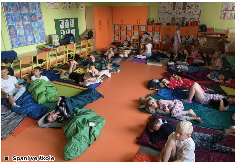
■ Spaní ve škole