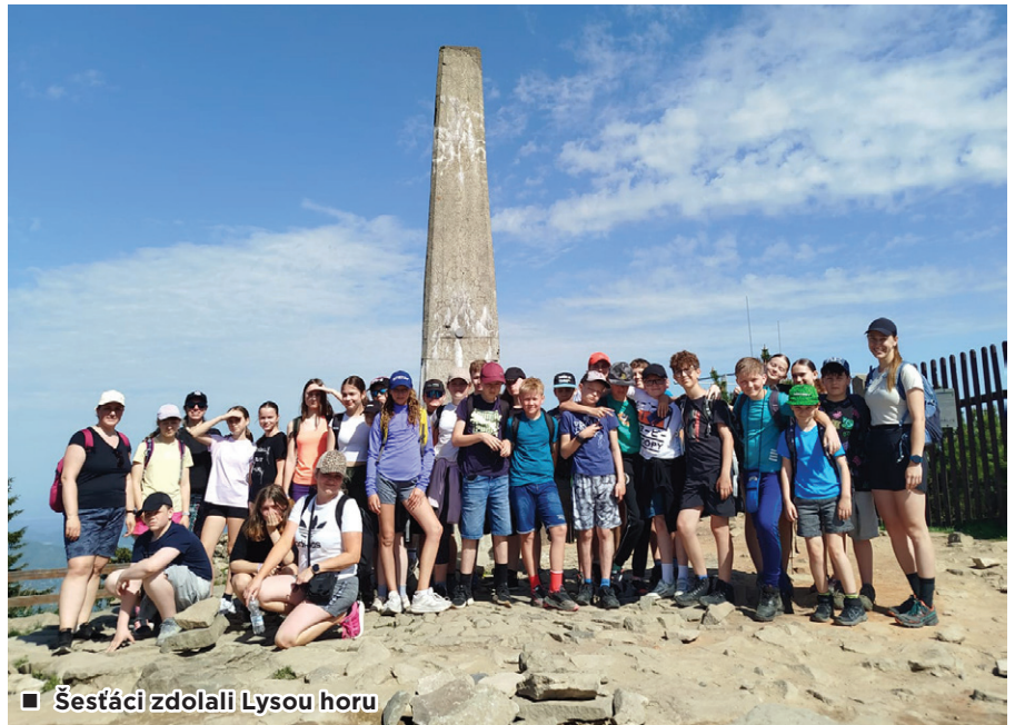
■ Šestáci zdolali Lysou horu

Ve středu 27. května se žáci šestých tříd vydali na turistický výšlap na Lysou horu.