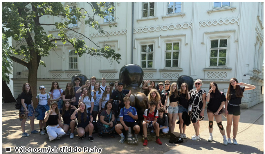
■ Výlet osmých tříd do Prahy

Dne 27. května se žáci osmých tříd vydali na školní výlet do Prahy. Čekal nás zajímavý den plný poznávání známých památek a zajímavých míst. Nejprve jsme navštívili historické centrum města, kde