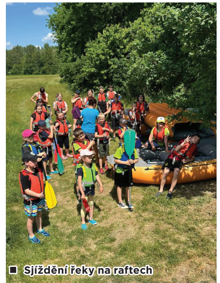
■ Sjíždění řeky na raftech

závodů v Dolní Lhotě. Pro dětský kroužek byla letos opět naplánována akce – sjíždění řeky na raftech. Letos nás čekala o hodinu delší trasa z Chomoutova do Olomouce, protože hodinová trasa na Mlýnském potoce v Olomouci byla už pro naše děti málo náročná. Tuto akci jsme si moc užili. Do konce léta nás čekají ještě závody v Krásném Poli a v Dolní Lhotě. O prázdninách nás čeká krátká pauza a v červenci třetí ročník příměstského tábora. Přeji všem dětem a rodičům hezké