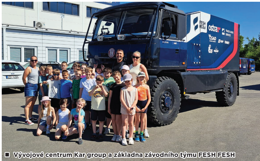
■ Vývojové centrum Kar group a základna závodního týmu FESH FESH

Třída 3. A jela na výlet do Kopřivnice. Cílem nebylo muzeum, ale přímo