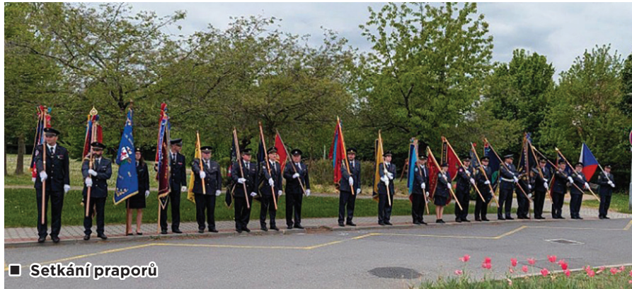
■ Setkání praporů

konání Ostravského Majálesu. Obě akce se obešly bez nutnosti zásahu. Na konci května jsme pak přijali pozvání na akci pro veřejnost ve Lhotce, kde probíhal golfový turnaj. Naše jednotka zde provedla ukázkou techniky, ukázkou hašení