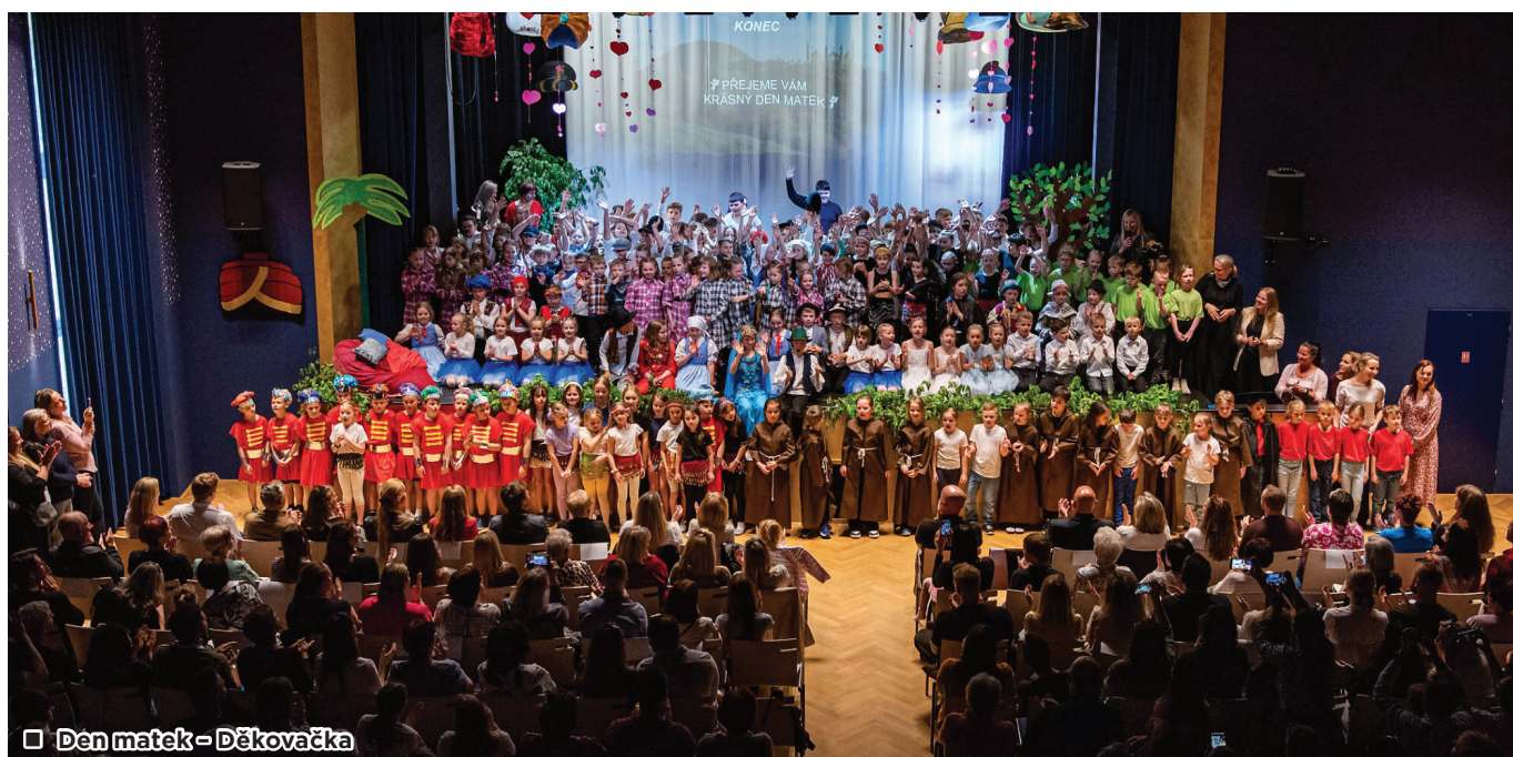
Den matek = Děkovačka