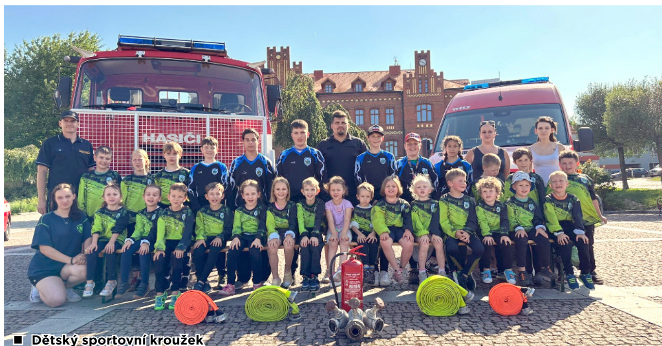
■ Dětský sportovní kroužek