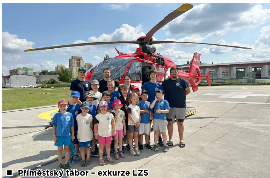
■ Příměstský tábor – exkurze LZS