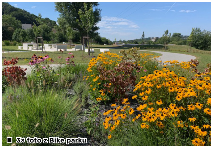
□ 3x foto z Bike parku