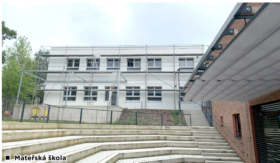
■ Mateřská škola