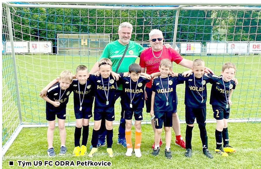
■ Tým U9 FC ODRA Petřkovice