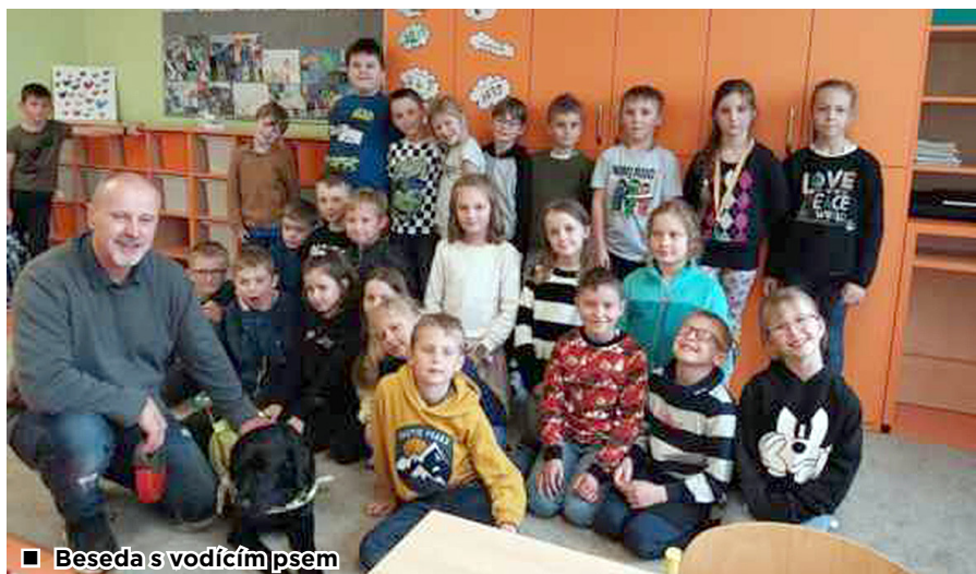
■ Beseda s vodčím psem