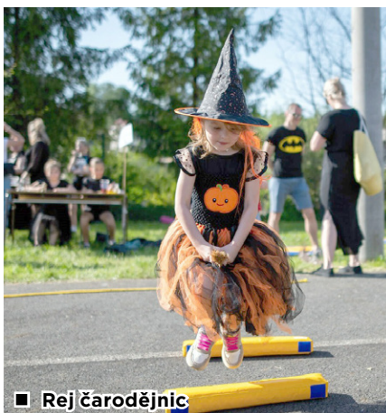
■ Rej čarodějnic

V úterý 30. dubna jsme se opět podíleli na organizaci akce Rej čarodějnic. Počasí nám přálo, sluníčko hřálo skoro jako v létě, takže areál Starého nádraží opět praskal ve švech. Do soutěží se zapojilo téměř 200 malých čarodějnic a čarodějů. Všichni s vervou plnili úkoly, sbírali razítka a těšili se na odměnu ve formě sladkosti a špekáčku. Kromě soutěží pro