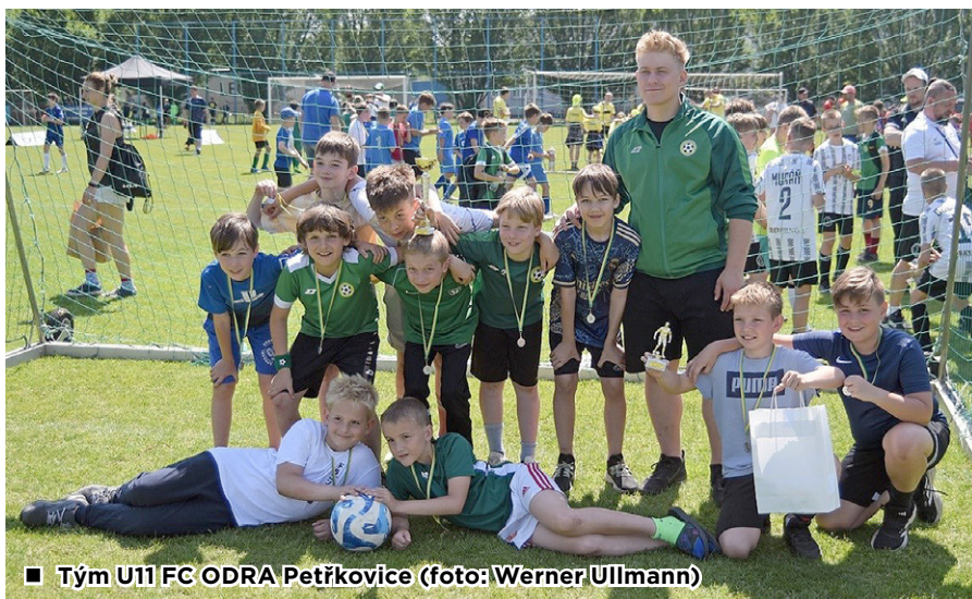
■ Tým U11 FC ODRA Petřkovice

Naše ODRA se představila v základní skupině A, ve které jednou vyhrála (vs. Polanka 5:3), dvakrát remizovala (vs. Star Goal Academy 0:0, vs. KKS Zabrzdowice 2:2) a třikrát prohrála (vs. FB Baník Ostrava bílá 0:5, vs. TJ Václavovice 2:3, vs. TJ Sokol Slavkov 1:5). Zisk 5 bodů a skóre 10:18 stačily v silné a pestré konkurenci na 6. místo.