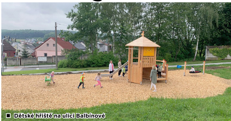
■ Dětské hřiště na ulici Balbínové

a kladné ohlasy rodičů nás ubezpečily, že vybudovat na tomto území prostor pro malé „bajkery“ bylo správné rozhodnutí. Prostor si prohlédl i pan primátor a přislíbil další finanční prostředky na rozšíření Bikeparku. Pokud se vše podaří, tak na podzim vybudujeme přírodní hliněnou trať a osadíme prostor balančními prvky. Doufejme, že se to letos stihne. A když bude mít někdo nápad, co udělat dál s tímto prostorem (až po pilíře), tak budeme s úpravami pokračovat. Nově byly umístěny hrací prvky v parčíku u „Balbínky“ a v září začnou výsadby a terénní úpravy tohoto prostoru. Byla také ukončena úprava dvoru na ul. Hlučínská, doufám, že ke spokojenosti všech. Dle harmonogramu také pokračuje naše doposud