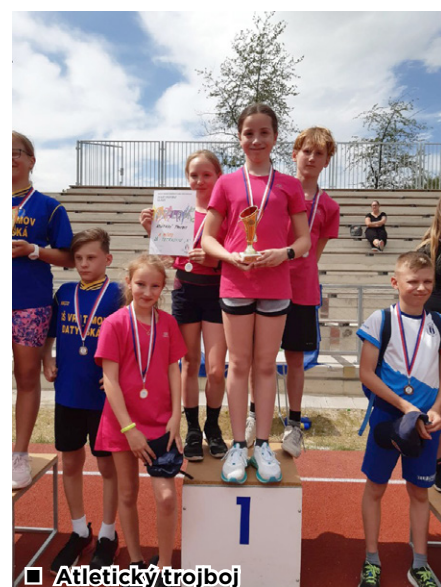
■ Atletický trojboj

Dne 2. května se vybraní žáci 4. a 5. ročníku zúčastnili atletického trojboje, pořádaného klubem Atletika Poruba na jeho nově otevřeném atletickém stadionu. Smíšená družstva soutěžila ve štafetě 4x60 m, hodu kriketovým míčkem, skoku dalekém a sprintu 50 m. V silné konkurenci 49 družstev z 26 základních škol slavilo jedno ze dvou družstev reprezentujících petřkovickou základní školu obrovský úspěch umístěním na 1. místě, čemuž v první chvíli nikdo nevěřil. Děti z něj měly o to větší