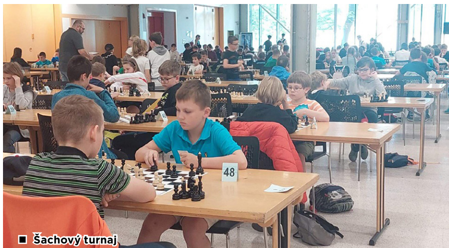
■ Šachový turnaj