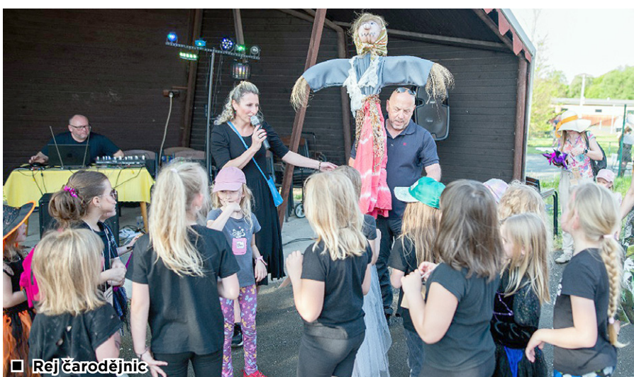
■ Rej čarodějnic