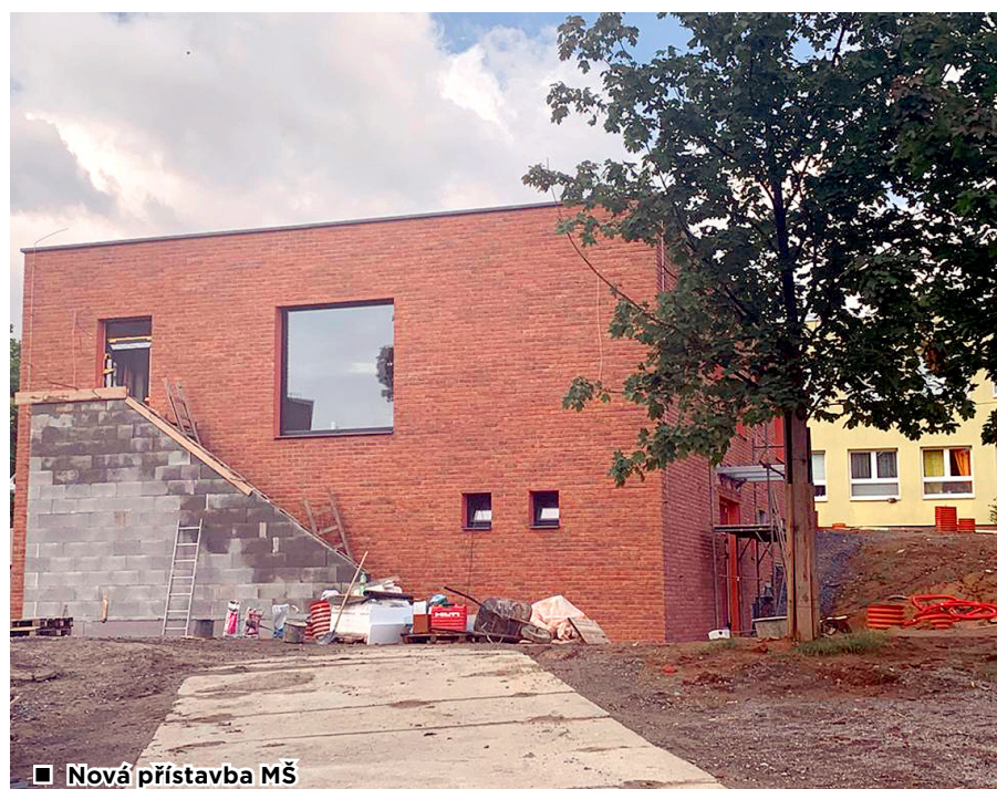
■ Nová přístavba MŠ

Práce také finišují na opravě kanalizace na ulici Jahodová, která se dočká po šesti letech nového povrchu, za což děkuji městu Ostrava, i když to není přesně dle představ některých spoluobčanů.