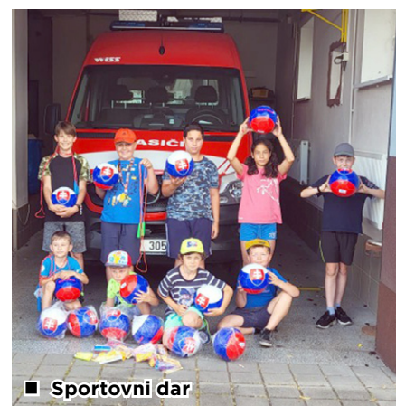
■ Sportovní dar

stromy – první na cyklostezce pod Lanškem, druhý pak v Ostravě-Hoštkovicích a třetí v naší části Nordpol. V měsíci červenec proběhla také historicky první odborná stáž na stanici HZS MSK v Ostravě-Přívoze. Jednotka ve složení 4 vybraných členů a s CAS32 T815 strávila 12hodinovou službu, kde se