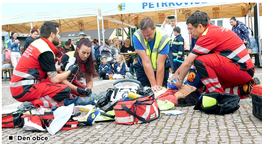
■ Den obce

Ve výjezdové jednotce jsme měli také napilno. Po spoluúčasti na Dětském dni s IZS jsme byli navštívit opět děti v MŠ a ukázat jim svou techniku a vybavení. Jednalo se o MŠ v Ostravě-Přívoze. Děti si tak prohlédly obě zásahová vozidla, vyzkoušely si přetlakový ventilátor či si mohly vyzkoušet stabilizaci osob na páteřové desce. Děti náramně ocenily, že se náhodně jednalo o jejich učitelky. Jednotka dále na oplátku asistovala u akce