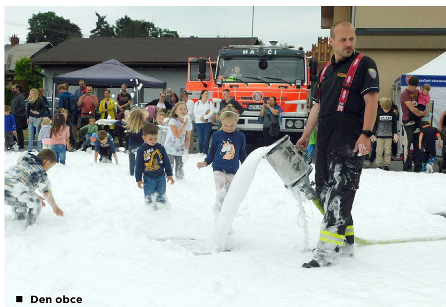
■ Den obce

konané Rančem U Rudolfa v Bobrovnicích. Jednalo se o ukázkou techniky u konaných závodů koní. V tomto horkém dni tak jednotka provedla i svažení místa akce a krom návštěvníků i přítomných zvířat. Během proběhlých dvou měsíců měla jednotka celkem 3 ostré výjezdy. Jednalo se vždy o popadané