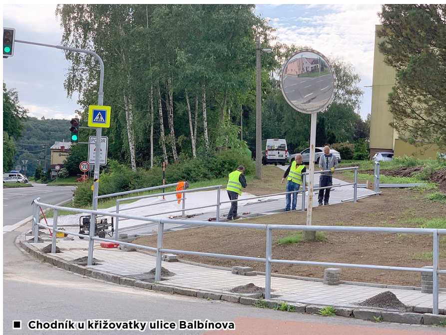
■ Chodník u křižovatky ulice Balbínova

školky, je již hotová fasáda a probíhají práce uvnitř stavby. Zároveň se budou provádět terénní úpravy v okolí přístavby, aby bylo možné na podzim přemístit děti do nové budovy a do provizorní třídy, která vzniká na prvním stupni ZŠ. Chtěl bych tímto poprosit všechny normální občany, aby byli tolerantní k této stavbě i v neděli, kdy probíhají práce na náš popud, abychom to stihli do začátku školního roku. Občan se sice vespinká, ale děti nenastoupí včas do školky.