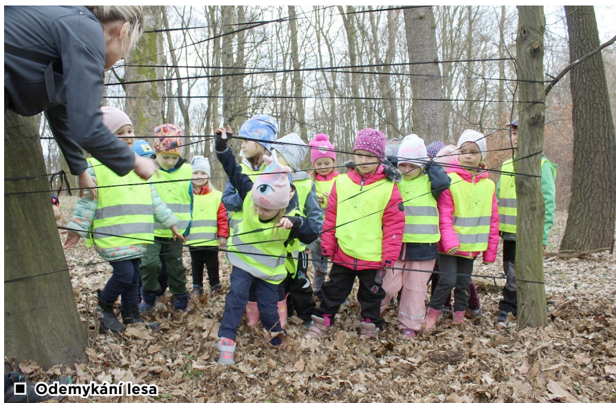
■ Odemykání lesa