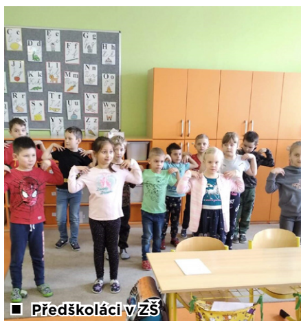
■ Předškoláci v ZŠ