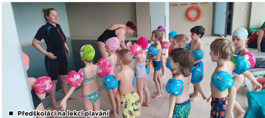
■ Předškoláci na lekci plavání