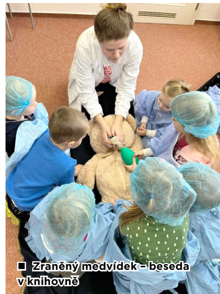
■ Zraněný medvídek - beseda v knihovně

zábavné dopoledne včetně promenády masek, hudby a tance.