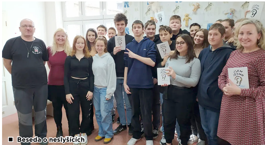
■ Beseda o neslyšících

se spoustu zajímavostí, jak chránit sluch, jak vypadá a funguje budík pro neslyšící, jak vypadá kochleární implantát a spoustu