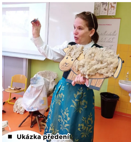
■ Ukázka předení

„A paní učitelko, nebudete mít z toho předení tu velkou nohu, velký palec a ten velký pysk, jako ty tři přadleny v pohádce?“