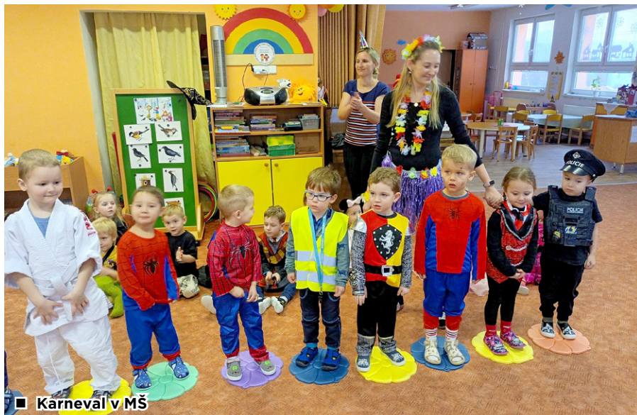
■ Karneval v MŠ