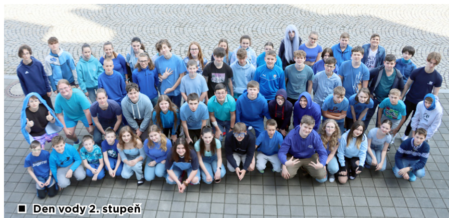
■ Den vody 2. stupeň

jsem ráda, že existuješ. Bez tebe bych tu nebyla. Jsi všude kolem mě. Jsi ve vodovodu, v řece a v jezeru. Děkuji, že živiš všechny mé kamarády, rodinu a jiné lidi. Vždy, když mě bolí hlava, ostatní mi řeknou: "Napij se." A já se napiju. Rodiče vezmou ručník, namočí ho do tebe a dají mi ho na mou bolavou hlavu. Tvůj zvuk