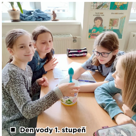
■ Den vody 1. stupeň

je uklidňující a příjemný. Tvá barva je modrá a modrou vidíte skoro všude, jako nebe, rostliny, domy, auta a tak dále. V moři v tobě můžeme najít mnoho pokladů, např. škeble, krásně zbarvené rybky a šperky, které mohli lidé ztratit. Bez tebe nepřežijeme týden a při sportu si trochu srkneme vody a to nás nakopne zpět do kondice. Nelíbí se mi moc, jak tě my lidé znečišťujeme, házíme odpadky a vpuštěme do tebe různé škodlivé látky.