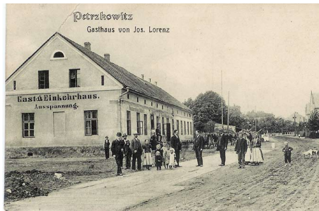
■ Náves v Petřkovicích po r. 1911 – promenáda po zatrubnění