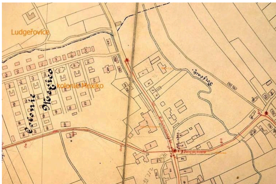
■ Výřez mapy nového vodovodu v centru Petřkovic z roku 1906 – je zde vidět nezatrubněný potok