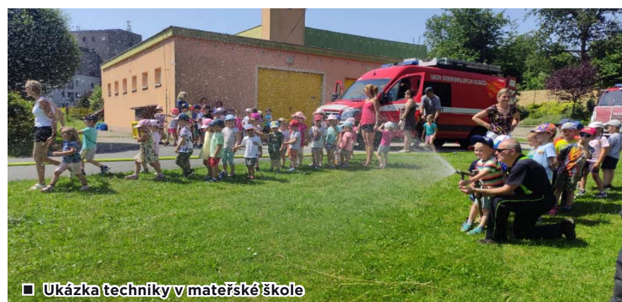
▣ Ukázka techniky v mateřské škole

vyzkoušet, jak se mají zachovat při vzniku požáru. Po skončení akce se jednotka zapojila do organizace Dětského dne s IZS, o kterém se zmíním níže. Těsně před konáním akce však dostala jednotka pokyn k výjezdu, a tak musela vyjet kvůli spadlému stromu, který shodil elektrické vedení na ulici K Lidicím. Další nahlášený spadlý strom na stejné ulici byl jednotce nahlášen 1. července.