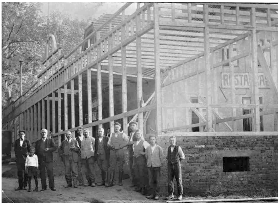
■ Přístavba z roku 1929

V současnosti je majitelem restaurace René Růžička, vnuk Zigiho Sněhoty. Ten restauraci pronajímá. Restaurace má kapacitu 60 míst. Pracují zde 2 zaměstnanci v celotýdenním provozu.