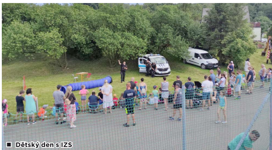
■ Dětský den s IZS

V hasičském sportovním kroužku mladých hasičů probíhal zejména nácvik práce s hadicemi. Děti si mohly také opět prozkoušet první pomoc, a to za pomoci AED – automatizovaného externího defibrilátoru. Na figuríně si procvičily KPR – kardiopulmonální resuscitaci a mohly si projít se školitelem vše, co je zajímavé. Některé z dětí se pak podílely na akci Dětský den s IZS, kde pomáhaly na stanovištích soutěžních disciplín. Za pomoc jim tímto děkujeme. Na rozloučení školního roku pak dostaly děti malé dárečky a již nyní se těšíme na zahájení druhé poloviny sezóny, kdy plánujeme začlenit do výcviku i požární útok. Na 3. září máme v kroužku naplánovanou veřejnou akci, na kterou Vás srdečně zveme.