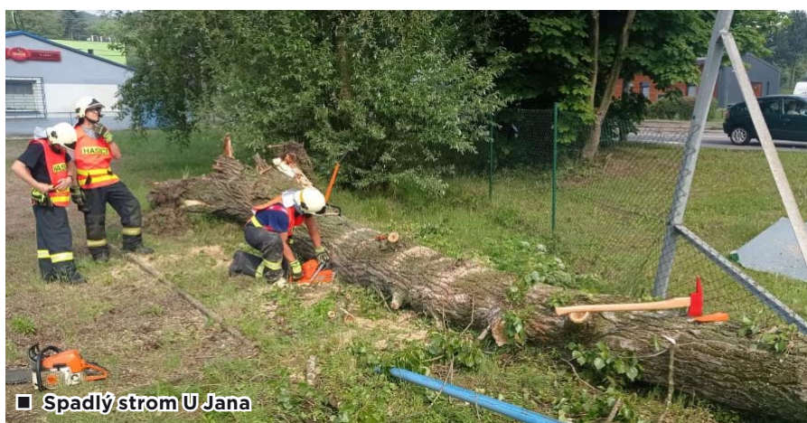
■ Spadlý strom U Jana

Ani činnost členů SDH nebyla pozadu. Jak již bylo zmíněno výše, za spolupráce s výjezdovou jednotkou byl uspořádán, tak jako minulý rok, Dětský den s IZS. Akce probíhala za podpory ÚMOB Ostrava-Petřkovice, ZŠ Ostrava-Petřkovice a Ministerstva školství, mládeže a tělovýchovy ČR. Lehce nešťastně zvolený páteční termín pravděpodobně způsobil menší účast, než tomu bylo právě o víkendu minulého ročníku. Nicméně i tak se zde letos sešlo plno organizací a spolků se svou technikou a prezentací činností. Mezi hosty, kteří přijali pozvání a udělali si tak zdarma čas pro naše obyvatele a kterým patří obrovská slova díky, jsou: HZSMSK, PČR, MP Ostrava, Celní správa ČR, JSDH Ludgeřovice, Ostrava-Nová Ves, Hošťálkovice, ČČK Ostrava, Rescue Ostrava, HZSp – drážní hasiči, Záchraný útvar Hlučín, městský útulek