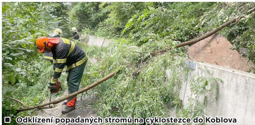
■ Odklizení popadaných stromů na cyklostezce do Koblova