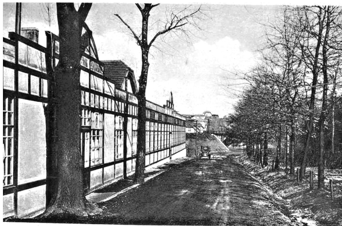
■ Během II. světové války