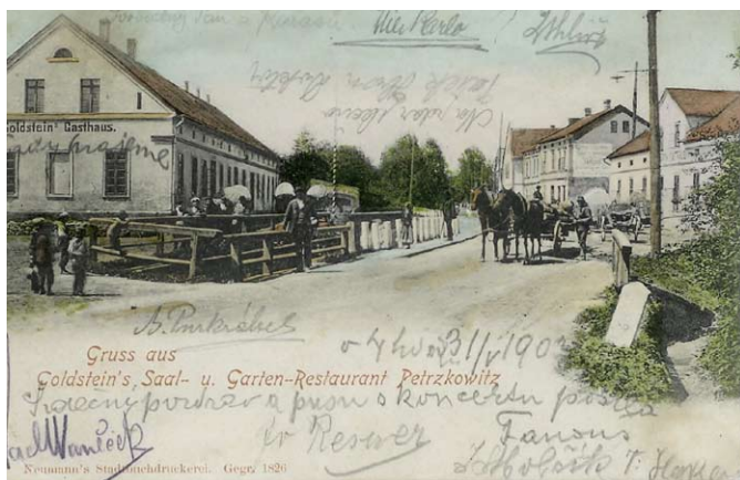
■ Náves v Petřkovicích počátkem 20. století – ještě nezatrubněný potok. Pozn.: Goldsteinův hostinec (vlevo) – dnes zde stojí kulturní dům