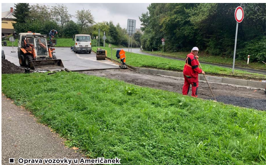
■ Oprava vozovky u Američanek