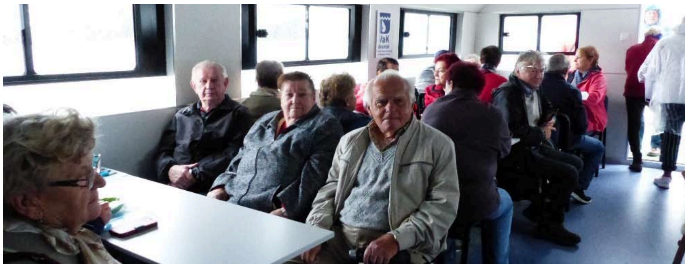
■ Senioři na Slezské Hartě