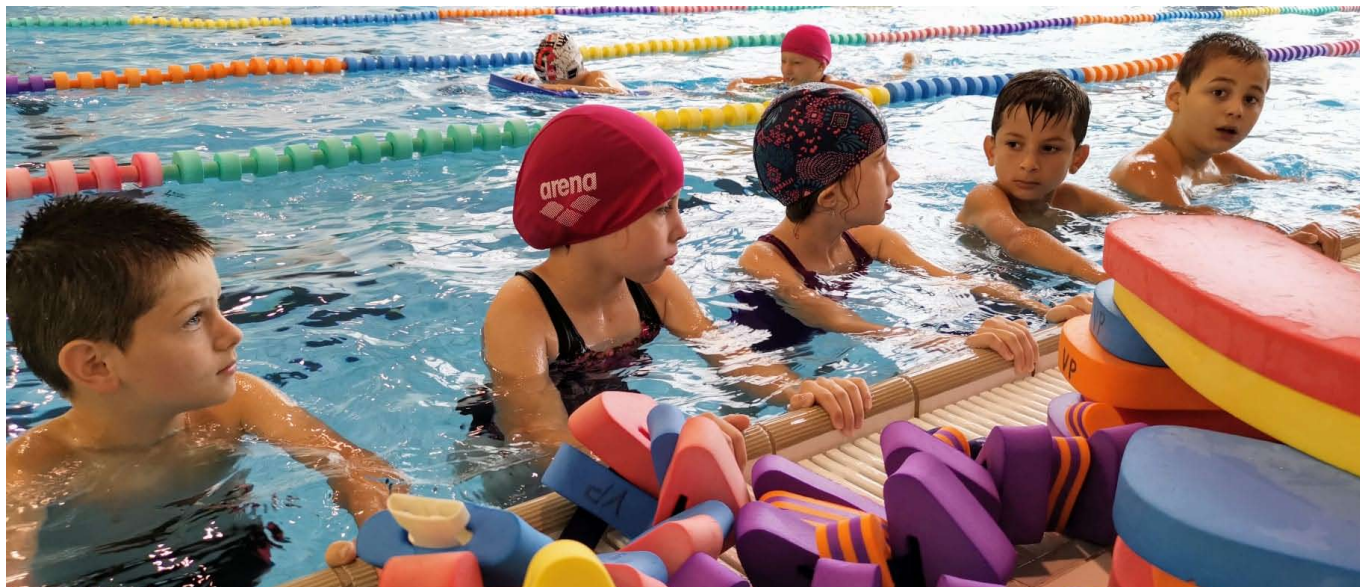
■ Plavání III. třídy