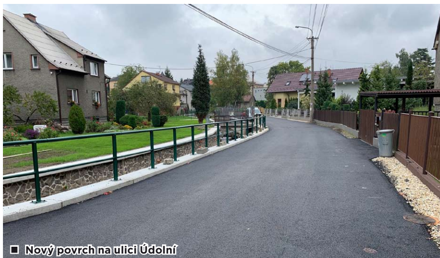
□ Nový povrch na ulici Údolní