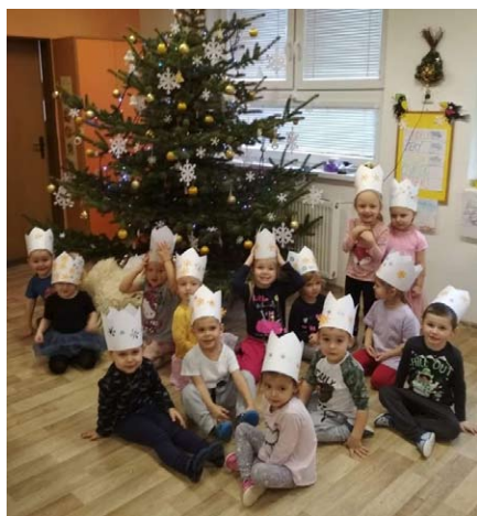
Tři králové ve třídě Sluníček.