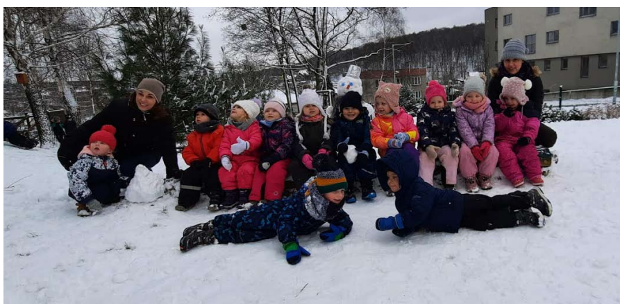
Zimní radovánky - Sluníčka