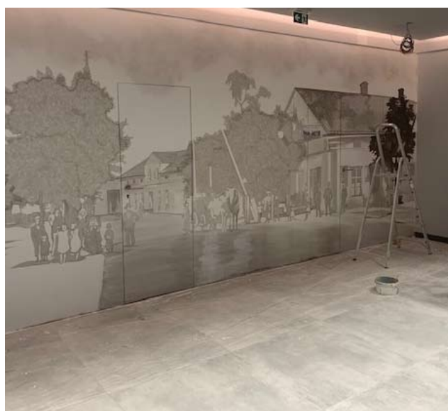
■ Předsálí se také pomalu rýsuje.