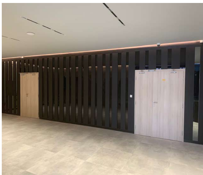
■ Pohled z předsálí na vchod do vinárny a restaurace.