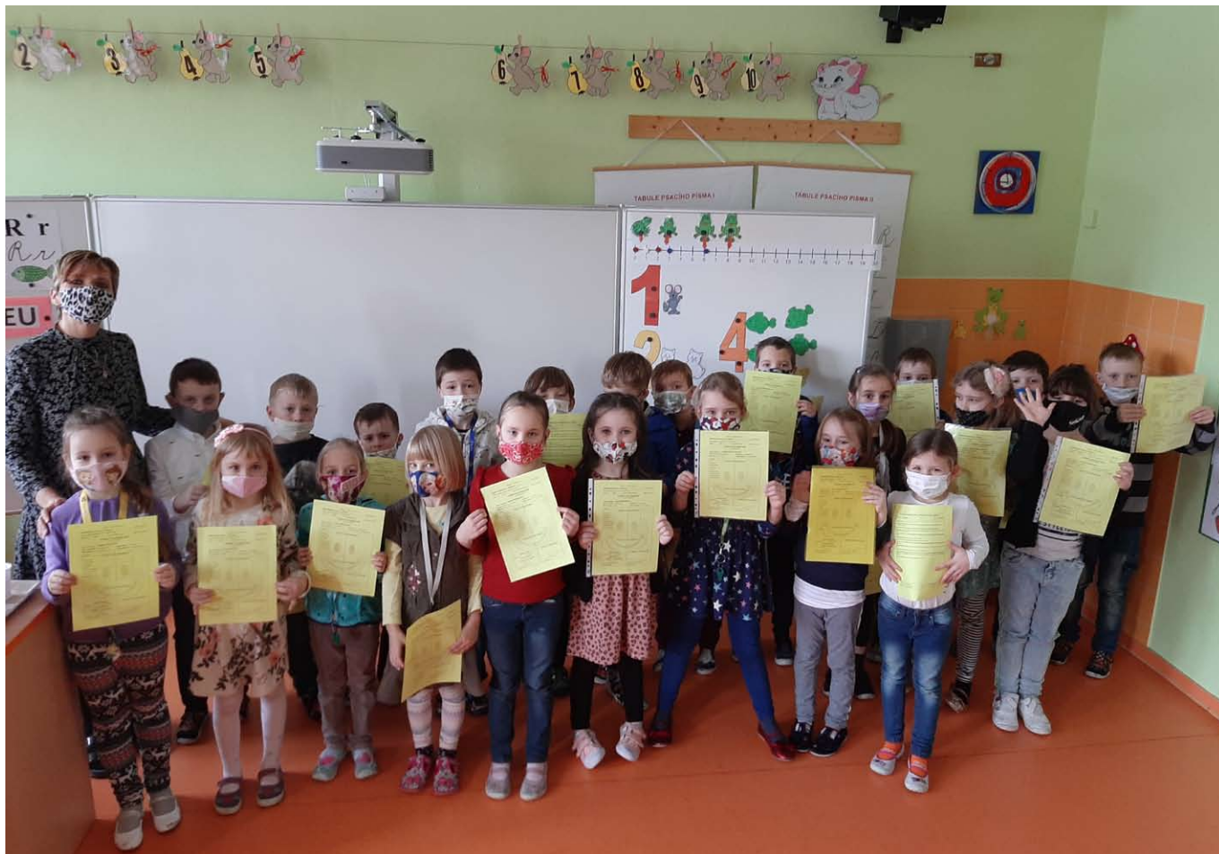
■ Žáci 1.B obdrželi pololetní vysvědčení.