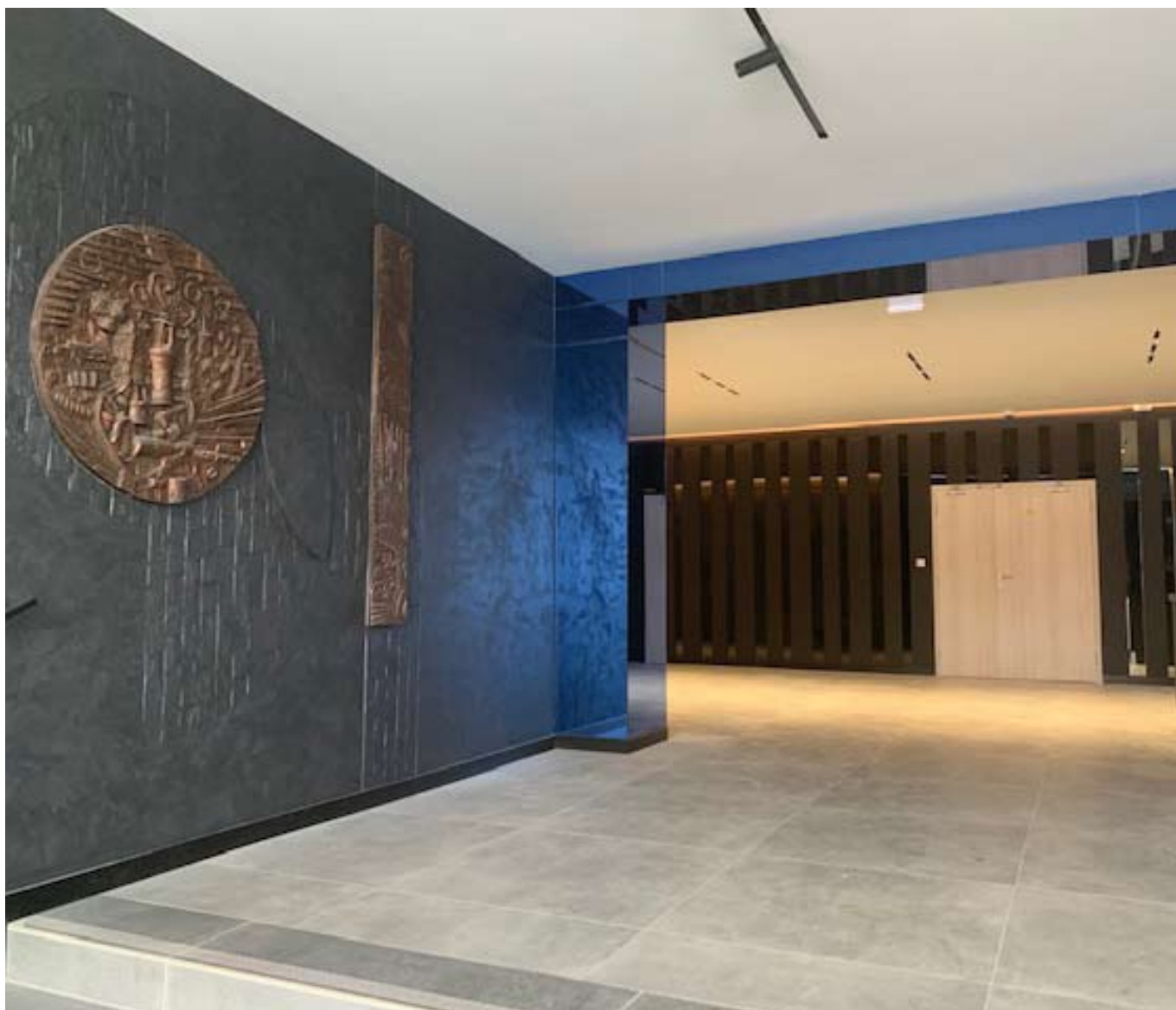
■ Vstup do KD v sobě snoubí historii s moderním interiérem.