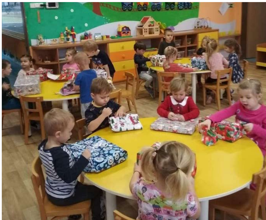
Vánoční nadílka po Vánocích ve třídě Sluníček.

na nákup nových hraček pod stromeček, a zvláště děkujeme také paní Janusové za poskytnutí sponzorského daru pro potřeby MŠ a paní Služy za výrobu krásných odznáčků pro děti.