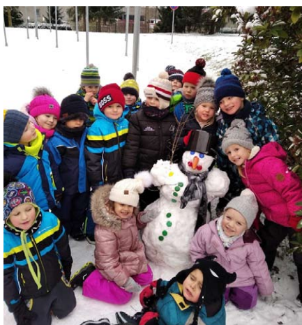
Zimní radovánky - Hvězdičky.

pozastaveny. Doufáme však, že bychom se k nim mohli v brzké době vrátit. Plánujeme pro děti připravit karneval, na který se už všichni velmi těší. Pro děti bude připraven dopolední program v maskách s tancem, soutěžemi i sladkou odměnou. Chtěli bychom, pokud to bude možné, obnovit i nadstandardní aktivity pro děti – výtvarné tvoření Barvička,