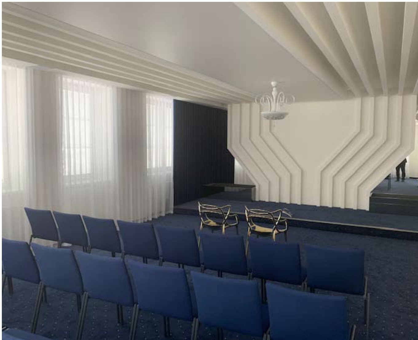
■ Obřadní síň těsně před dokončením - v květnu snad přivítáme první nové občánky.