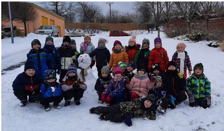
Zimní radovánky - Žabičky.

Z důvodu epidemiologických opatření byly některé aktivity dočasně