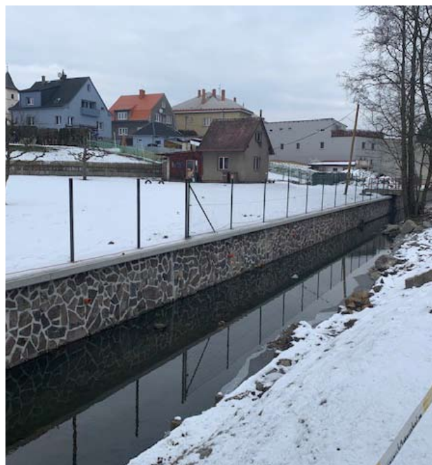
■ I v zimě se pracuje, mraz je nezastaví a výsledek stojí za to.