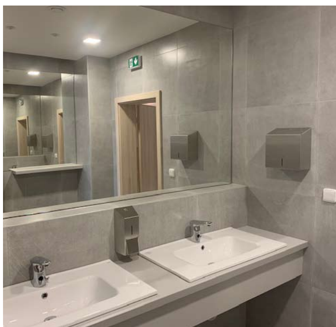
■ Kultivovaná proměna prostředí toalet.