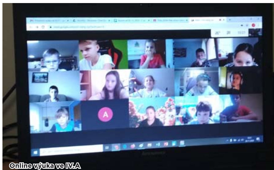
Online výuka ve IV. A

Už je to tu zas, covid přišel mezi nás. V měsíci říjnu se uzavřela škola, muselo se přejít na distanční výuku. U nás v Petřkovicích nic nového, již na jaře jsme si ji vyzkoušeli, proto to nebylo pro nás žádné velké překvapení. Jsem připraven – wifi, myš, PC, tiskárna, vše nachystáno, jen zasédnout. Mám v 6. A super „třídní“, s ní se nenudím, posílá spoustu zajímavých úkolů. Škola z domu je super, vstávám před 8. hodinou a o přestávce mám lehárko v lůžku, to není špatné, ale když něčemu nerozumím, chybí paní učitelka se svojí radou. Dnešní dobu nemám rád, přeju si, abychom tuto dobu v pohodě přežili a nesmysly neřešili.