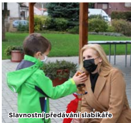
Slavnostní předávání slabikáře

Listopad bývá pro prvňáčky zlomový měsíc. Po dvou měsících jsou z nich už opravdoví školáci, kteří s hrdostí předvádějí rodičům v krátkém pásmu písniček a básniček, co se všechno naučili. Za svou snahu bývají odměněni při slavnostním předávání v aule školy za přítomnosti paní ředitelky a pana starosty první knihou – slabikářem. Letos to bylo jiné. Nouzový stav nedovolil cokoliv pořádat. Přesto jsme nechtěli naše prvňáčky ošidit