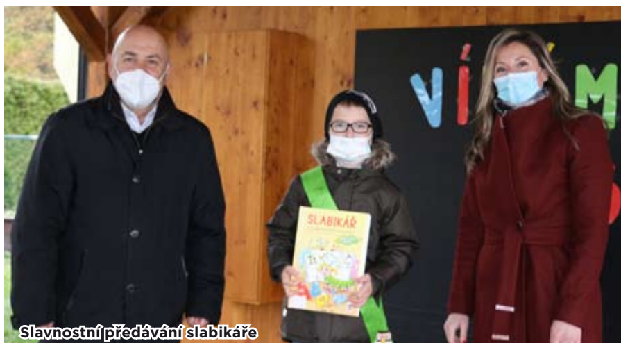
Slavnostní předávání slabikáře