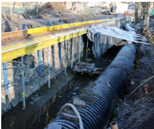
■ Pokračuje rekonstrukce Ludgeřovického potoka