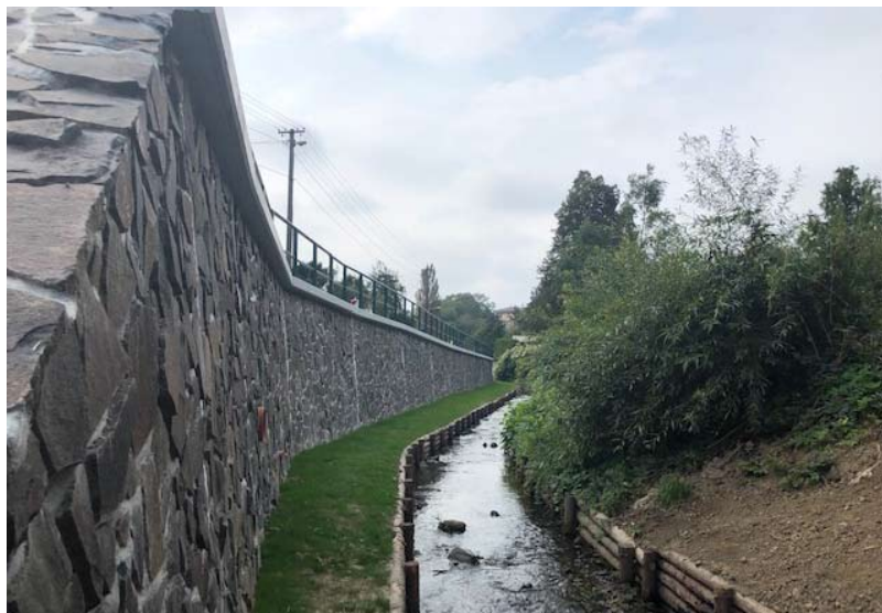
■ Pohled na opravenou část potoka