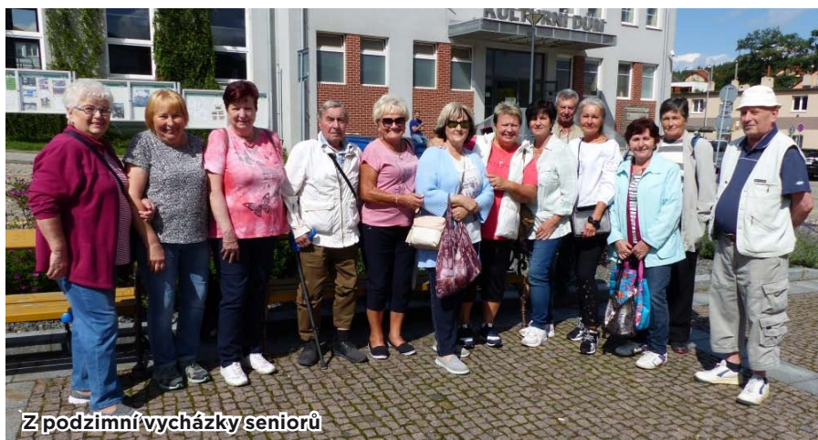
Z podzimní vycházky seniorů

a něco dobrého k zakousnutí. Všichni se skvěle bavili a s přáním uskutečnění dalších takových akcí jsme se rozešli domů.