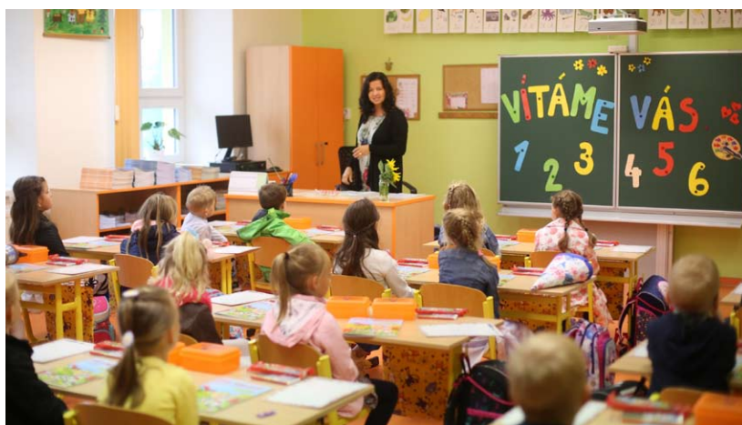
■ Vítání prvňáčků