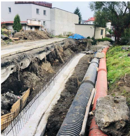
■ Rekonstrukce potoka pokračuje