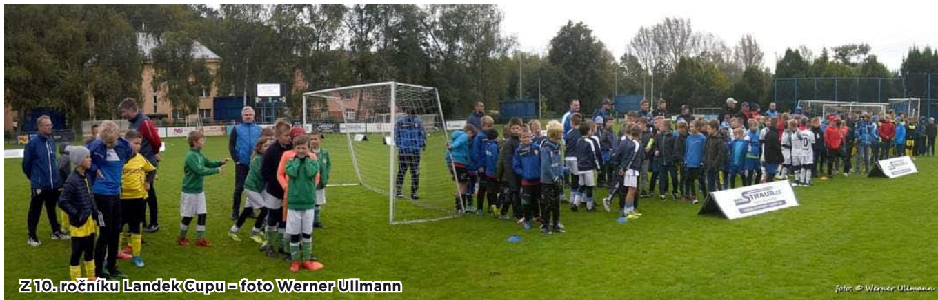
Z 10. ročníku Landek Cupu