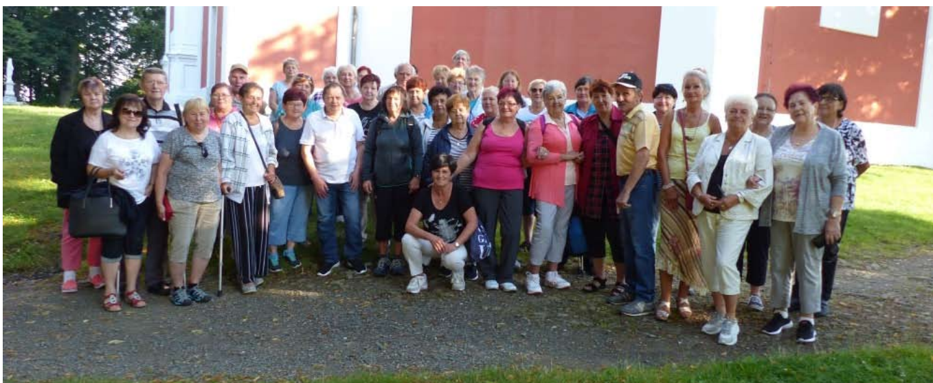
■ Senioři v Jeseníkách