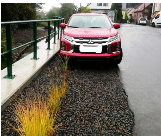
■ Nově vysazený pás trvalek není místem k parkování