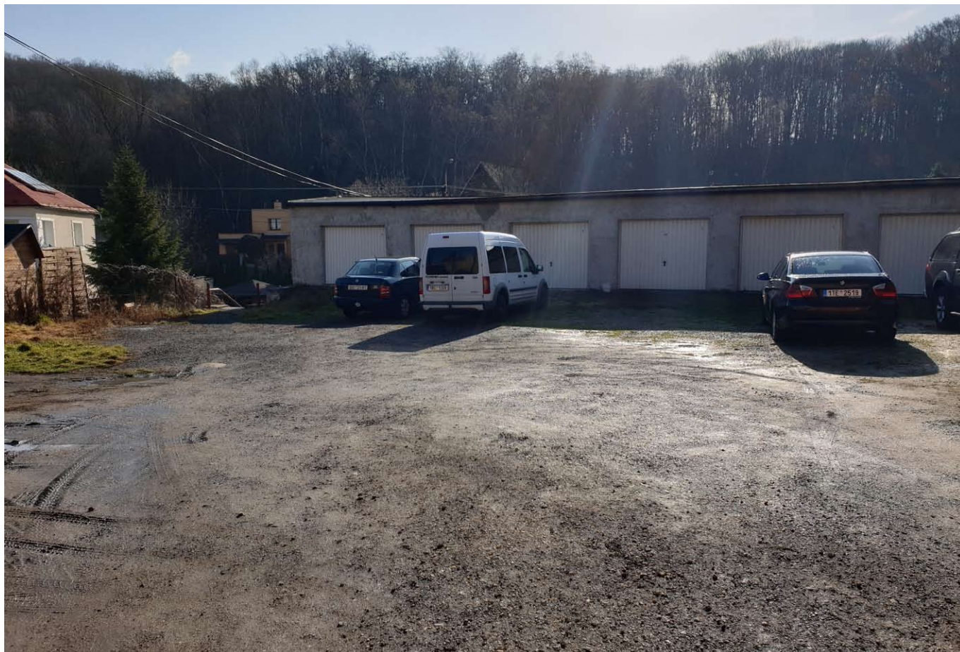
▲ Původní stav dvoru u „Kasina“ mezi ulicemi Hlučínská a Údolní ▼ Zahájení oprav dvoru u „Kasina“ mezi ulicemi Hlučínská a Údolní