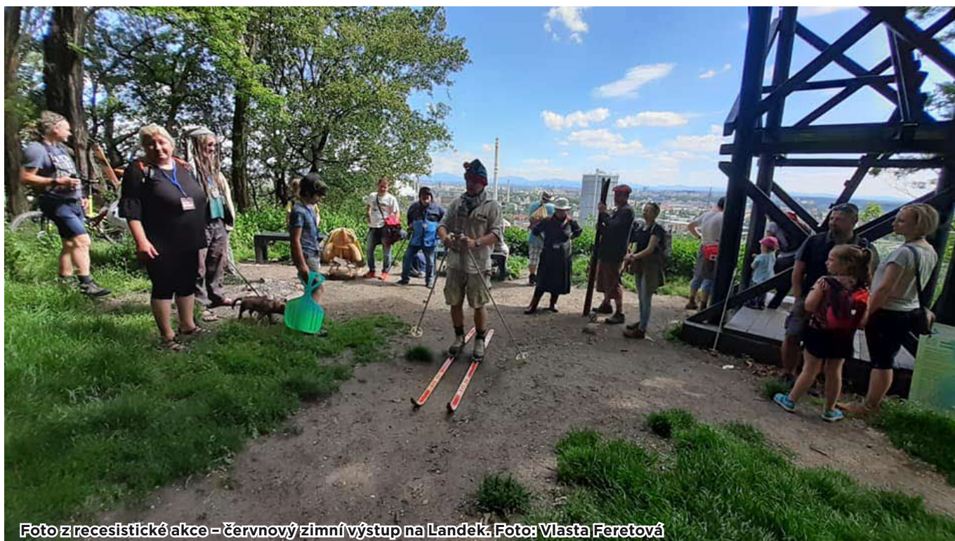
Foto z recesistické akce – červnový zimní výstup na Landek.