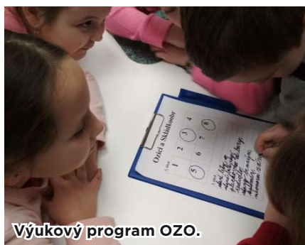
Výukový program OZO.

V rámci environmentální výchovy navštívili žáci 2. stupně ostravskou firmu OZO starající se o odvoz a zpracování odpadů na území města Ostravy. V jednotlivých výukových programech se dozvěděli, jak probíhá svoz odpadů, jak a proč třídit odpady, které sami vyprodukuji, a také zjistili, k čemu se recyklované materiály používají. Součástí zajímavé