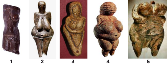
1. Petřkovická, 2. Věstonická, 3. Sibiřská, 4. Willendorfská, 5. Venuše z Hohle Fels

Nejznámější sošky gravettenců. Symbolem „Venuše“ je označila až naše moderní populace.