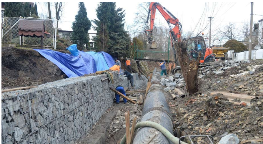
Pohled na probíhající úpravy břehů Ludgeřovického potoka na ulici Údolní. Vodní tok je dočasně sveden do provizorního potrubí.

V současné době probíhá soutěž na rekonstrukci dvou zastávek, a to u cukrárny