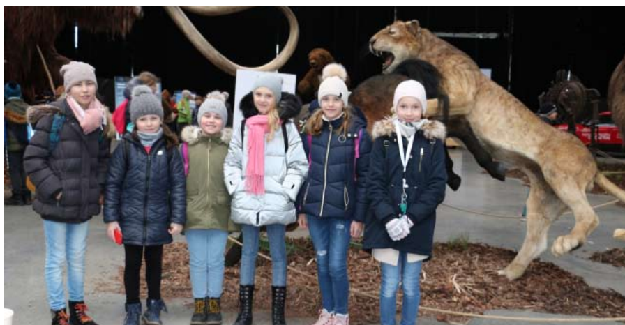
Žáci ZŠ na výstavě giganti doby ledové.