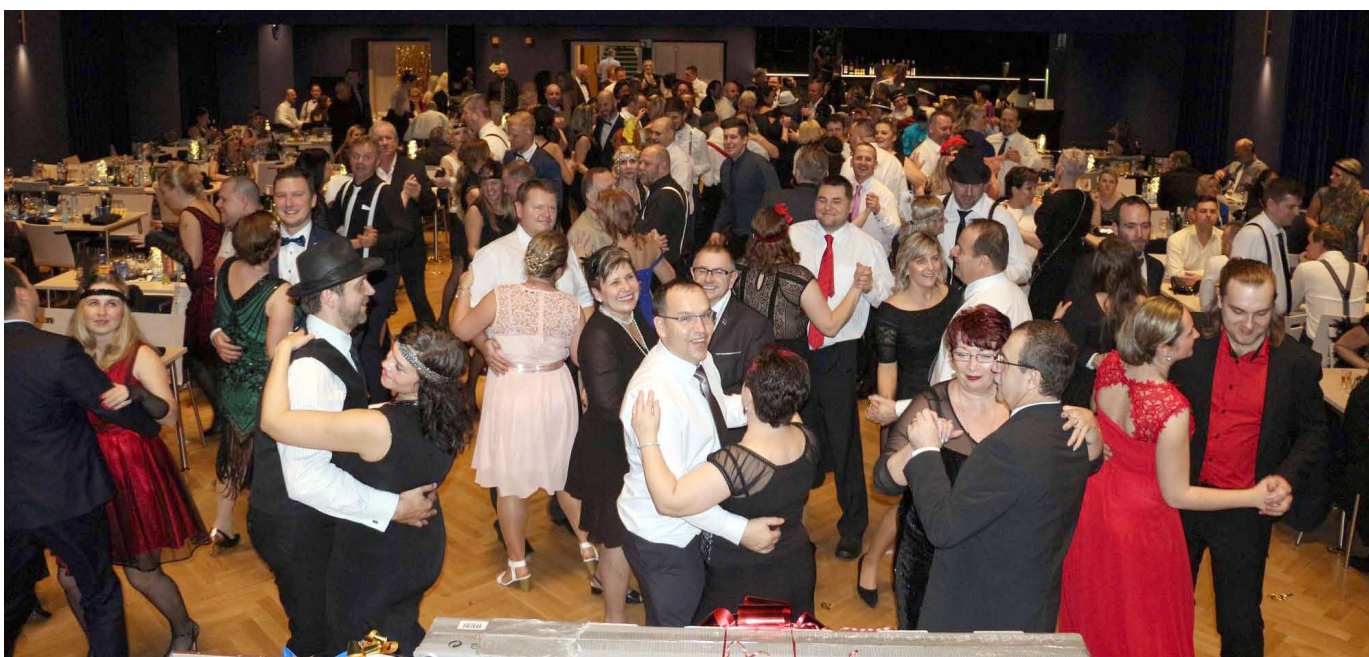
Plesová sezóna je v plném proudu.