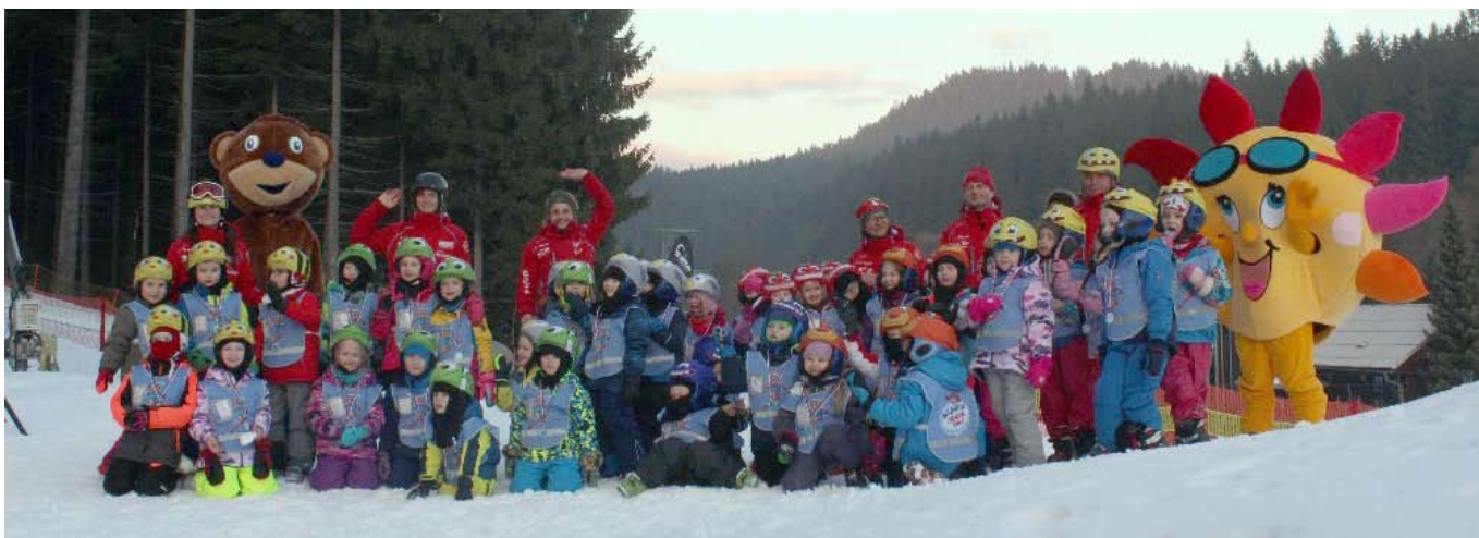
Děti z MŠ na lyžařském výcviku.