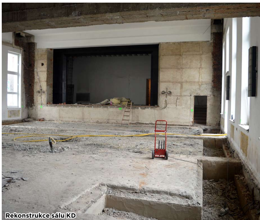
Rekonstrukce sálu KD