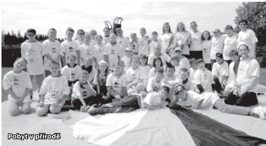
Pobyť v přírodě