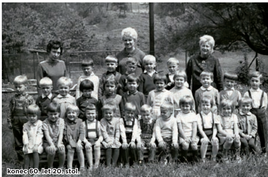
konec 60. let 20. stol.