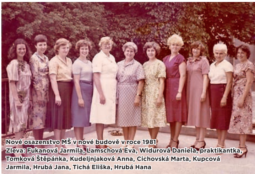
Nové osazenstvo MŠ v nové budově v roce 1981