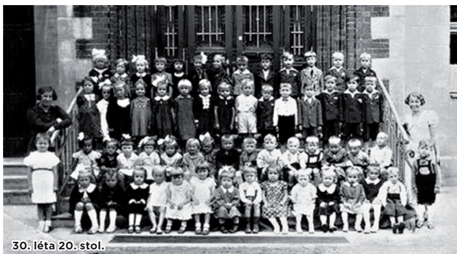
30. léta 20. stol.