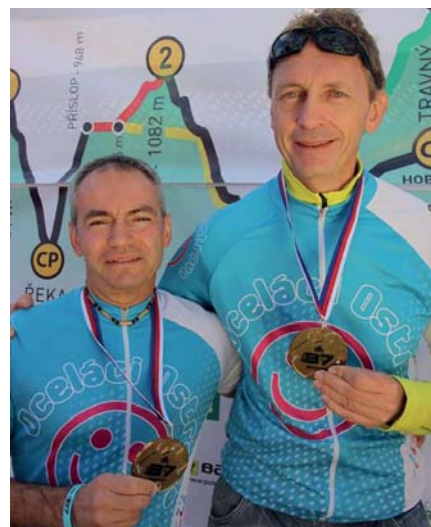
Vpravo Josef Bugner