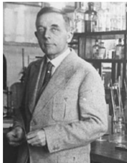
Držitel Nobelovy ceny Otto Heinrich Warburg (1883–1970)

Jak již bylo řečeno, je zcela nemožné, aby rakovinu dostal člověk, který se stravuje zdravě, pije hodně čisté vody a cvičí.