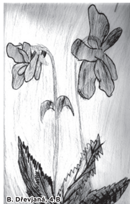
B. Dřevjaná, 4.B