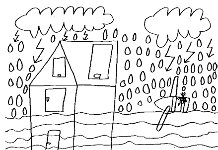
Miša Zdařil, 2. B

Maminky dnes svátek mají, louky už nám rozkvétají. Natrháme kytičky, pro ty naše matičky.