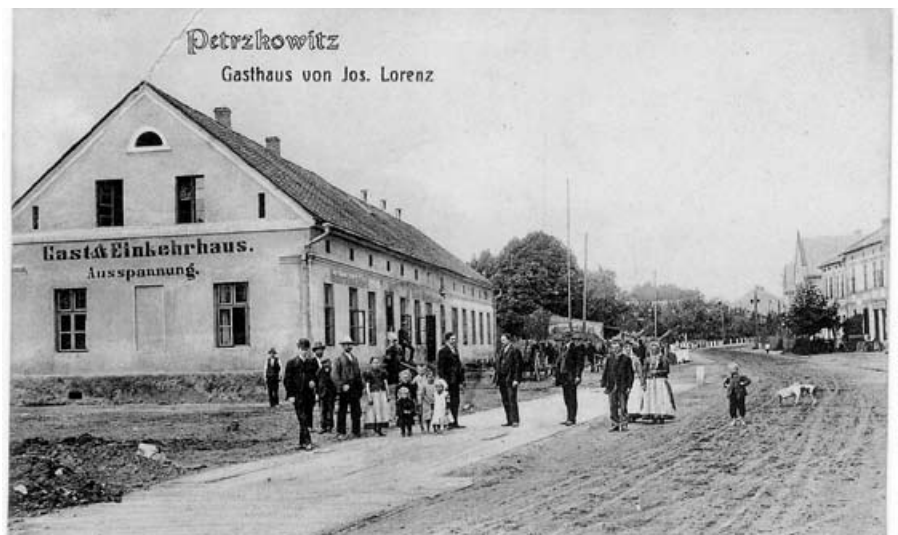
Náves v Petřkovicích po r. 1911 – promenáda po zatrubnění