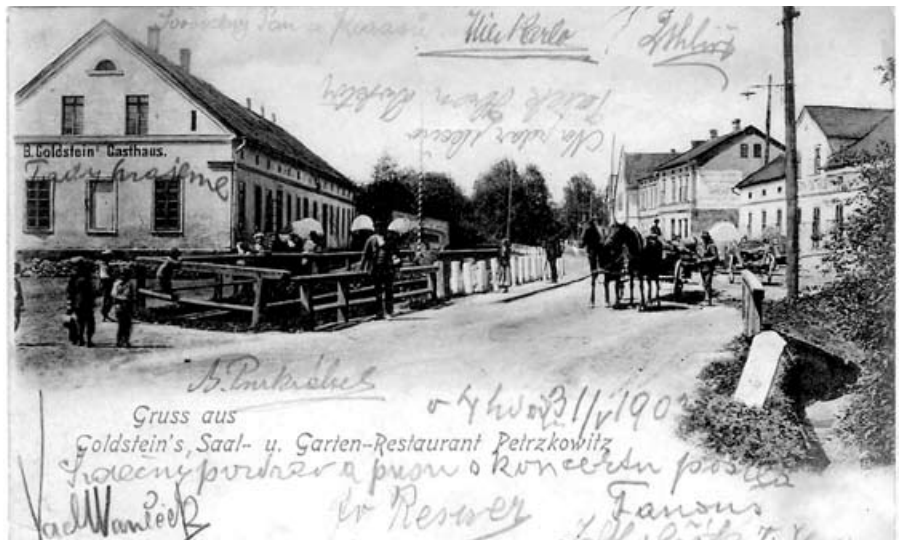
Náves v Petřkovicích počátkem 20. století – ještě nezatrubněný potok Pozn: Goldsteinův hostinec (vlevo) – dnes zde stojí kulturní dům