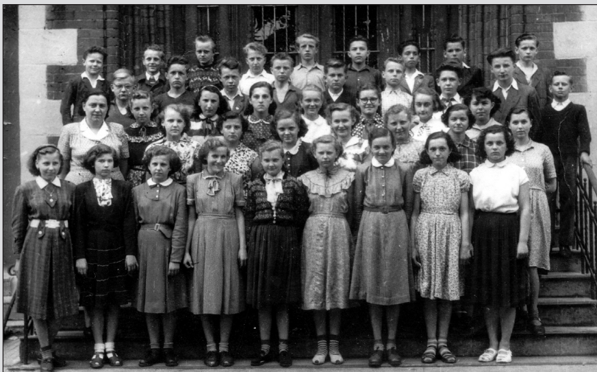
8. A. školní rok 1953–1954