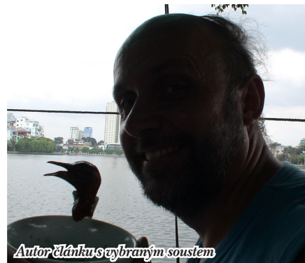
Autor článku se vybraným soustem