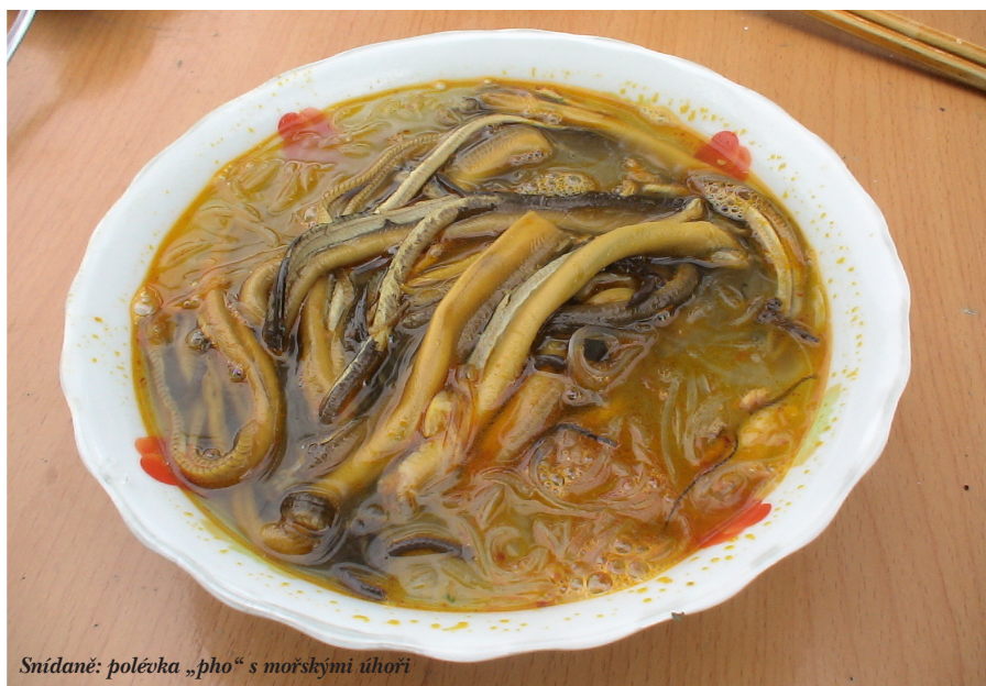
Snídaně: polévka „pho“ s mořskými úhoři