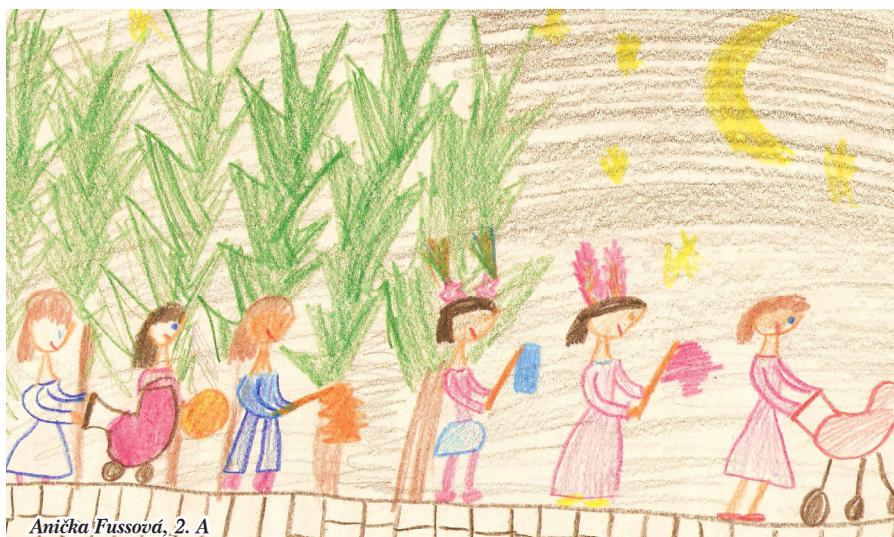
Anička Fussová, 2. A