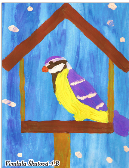
Vendula Škutová 4:B

Mapa Petřkovic přílohou zpravodaje jako vánoční dárek věrným čtenářům Petřkovického zpravodaje