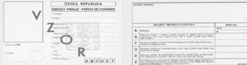
VZORY ŘIDIČSKÝCH PRŮKAZŮ PODLEHAJÍCÍCH VÝMĚNĚ: VYDANÝCH OD 1.1.1994 DO 31.12.2000