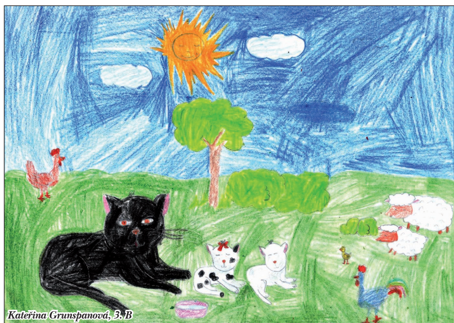
Kateřina Grunspanová, 3. B