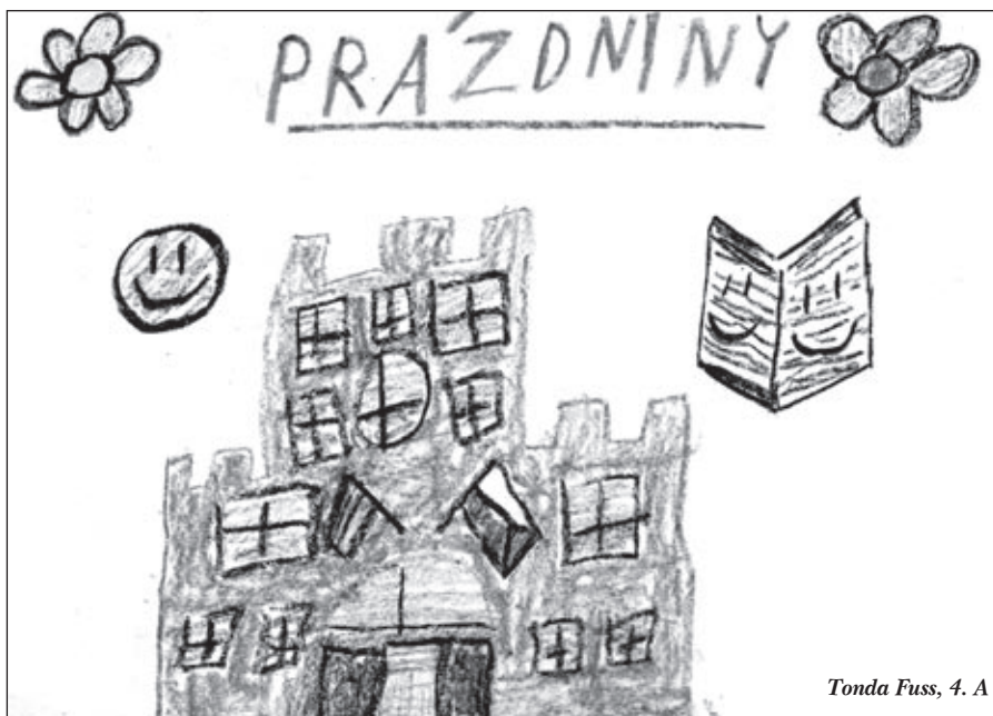
Tonda Fuss, 4. A