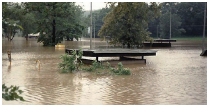
Zastávka MHD u Jana