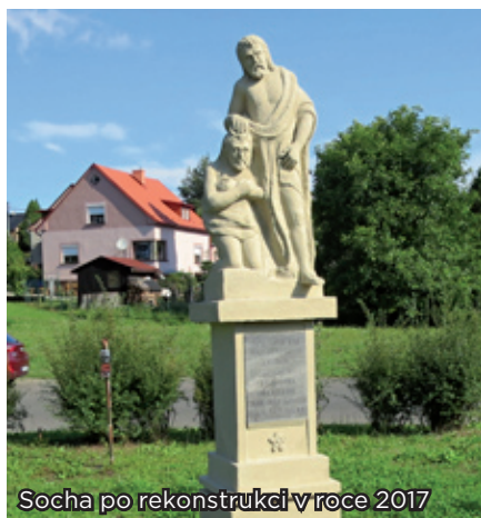
Socha po rekonstrukci v roce 2017