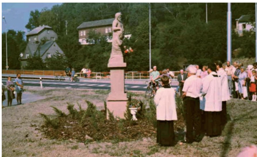
Vysvěcení a odhalení sochy v roce 1993