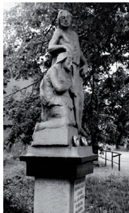
Původní umístění sochy před rokem 1993

Socha zde vydržela více než 150 let, ale znečištěné životní prostředí se na ni nemilosrdně podepsalo. Při výstavbě nové silnice na Hlučín po bývalém tramvajovém tělese došlo k přesměrování staré ulice Hlučinské, čímž se socha dostala mezi obě ulice. V té době již bylo 4 roky po „Sametové revoluci“ a přístup