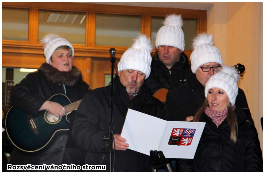
Rozsvěcení vánočního stromu