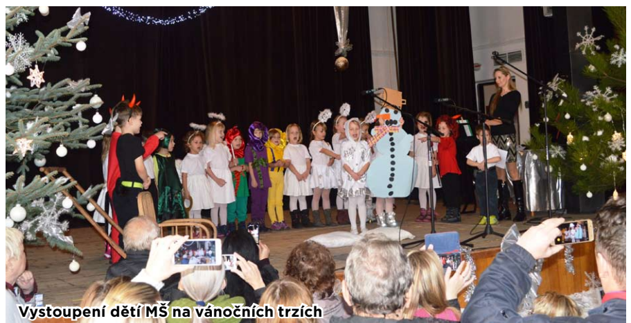
Vystoupení dětí MŠ na vánočních trzích

Tradiční Vánoční trhy se letos v Petřkovicích konaly ve dnech 23. a 24. listopadu v sále kulturního domu. Letošní trhy se nesly na vlnách vánočních koled a vystoupení. Kromě místní školy a školky zde vystoupily také školky z Ostravy a Ludgeřovic, zpestřením programu bylo i vystoupení mažoretek. Touto cestou bychom chtěli poděkovat všem vyučujícím, kteří pilně s dětmi nacvičovali, a všem dětem za jejich vystoupení. Dále bychom chtěli poděkovat panu starostovi