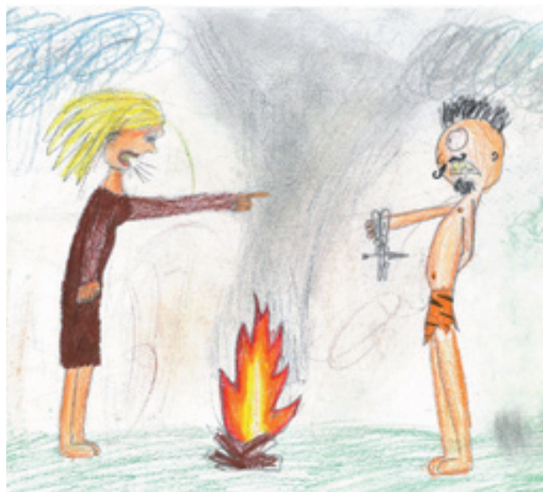
Ubrblaná pravěká žena

táta měl na mě čas... Můj děda je dobrý a jsme si blízcí, protože se o mě stará už od prvního roku... Tatínek je legrační, pracovitý, usměvavý, silný a hlavně statečný. Nejlepší zážitky jsou, když si hrajeme, a taky chvíle, kdy jsme spolu. Každá chvíle s ním je cenná, a proto ho mám tolik ráda... Tatínek umí být vtipný, ale někdy to přežene. Já mám tatínka ráda, protože chce být s námi a protože je můj... Mám tatínka rád, nechtěl bych jiného tatínka... Taťka má práci jako topič, baví ho to a také je v tom dobrý... Táta pracuje ve firmě Veolia. Práce ho tak asi nebaví, ale dělá to pro nás, abychom se užívali... Můj táta je moc hodný, ale jsem s ním jen málokdy, protože odchází brzo ráno do práce a přichází pozdě večer. Má moc rád houby, zejména ty jedlé... Tatínek je moc šikovný, protože postavil zevnitř dům a opravil komín a udělal mi houpačku... Stará se o naše bezpečí, je moc hodný a ve všem mi pomůže... Naučil mě hrát šachy, mám ho rád a jiného tátu bych si nepřál... Tatínek je velký vtipálek, ale je i přísný. Umí opravit a postavit vše i pergolu... Můj táta, no, to je trochu divné, já mám dva táty a moc se mi to nechce rozebírat... Tatínek hodně pracuje, takže se s ním v týdně moc nevidám. Má svaly, umí