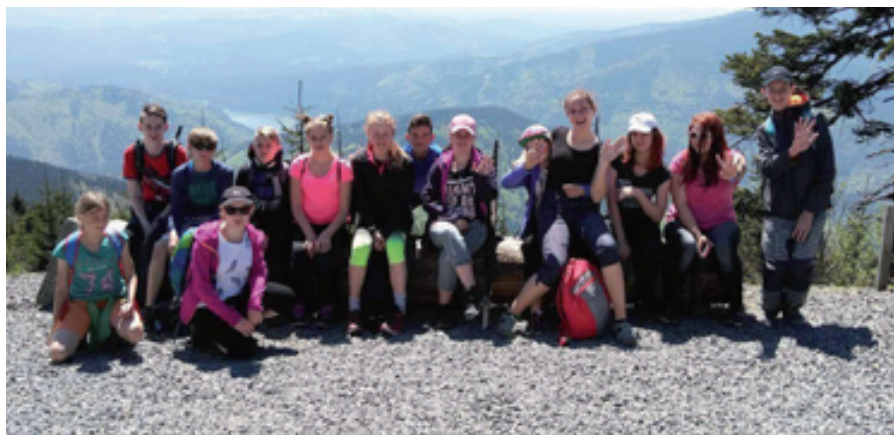
Výukový program na Lysé hoře

V pátek 19. května 7. třídy podnikly naučný výlet na Lysou horu. Stejný