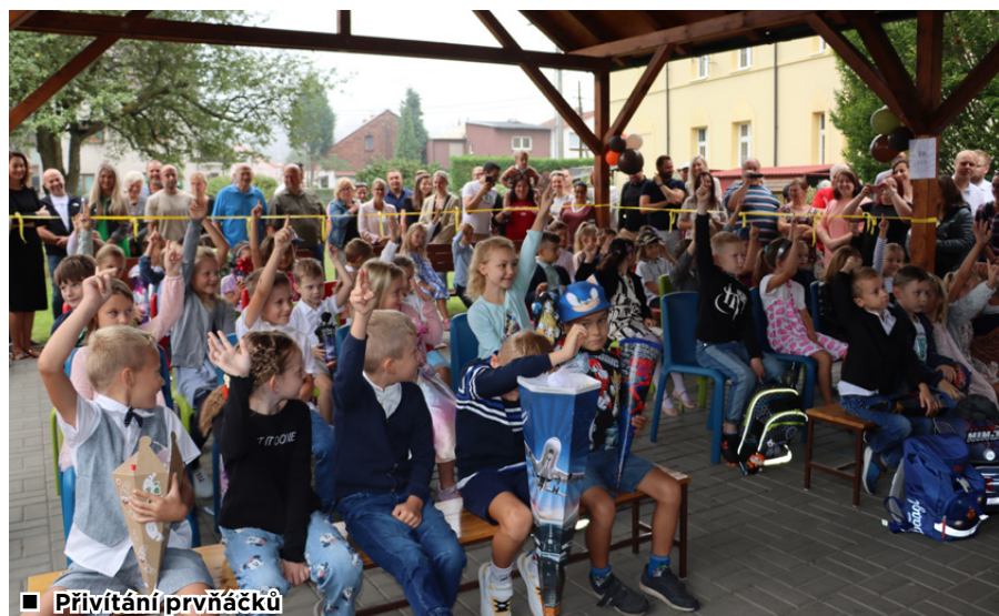
■ Přivítání prvňáčků