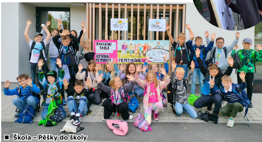
■ Škola - Pěšky do školy

ÚMOb Petřkovice ve spolupráci se Základní školou, Mateřskou školou a Základní uměleckou školou Ostrava-Petřkovice