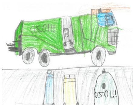
■ Štěpán Slavík 1.B

Od 10 let smí děti vyjet samostatně na kole na silnici. Aby to zvládly bez karambolů, absolvují společně se strážníky Městské policie Ostrava několik lekcí dopravní výchovy. Přípravu k získání Průkazu mladého cyklisty zahajují žáci