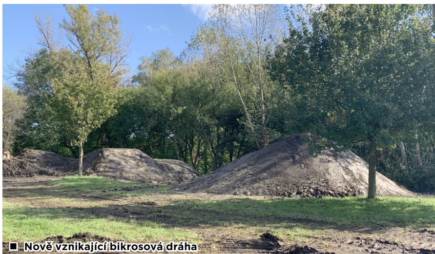
■ Nově vznikající bikrosová dráha

Velké poděkování patří celému krizovému štábu, se kterým jsme se zabydli ve školní jídelně a strávili spolu 96 hodin. Díky našim dobrovolným hasičům, pracovníkům úřadu, zaměstnancům školy a dalším dobrovolníkům se podařilo zčásti ochránit obecní majetek, pomoci