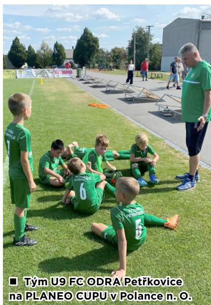
■ Tým U9 FC ODRA Petřkovice na PLANEO CUPU v Polance n. O.

V sobotu 28. 9. 2024 se před ostravskou radnicí (Prokešovo náměstí) uskutečnil