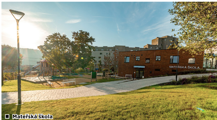
■ Materáská škola